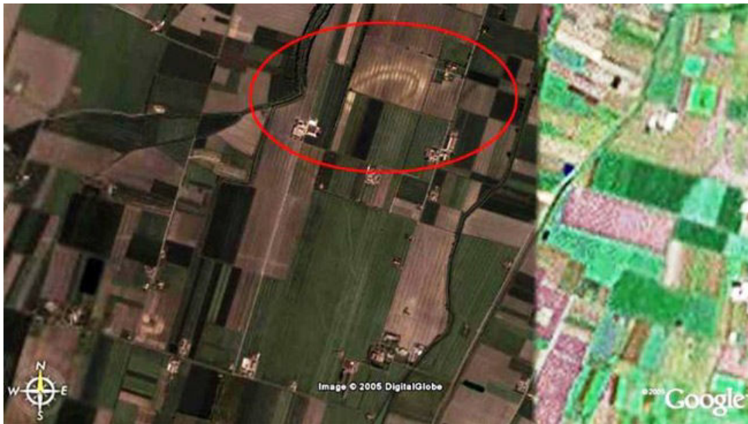
Рис. 1. Археологічне відкриття, яке було зроблено за допомогою програми Google Earth