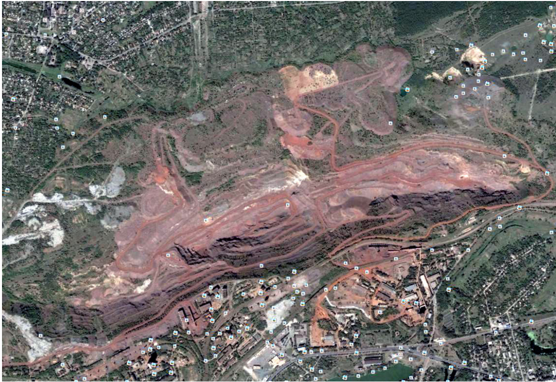
Рис. 3. Вивчення навколишнього середовища та екологічних проблем Кривбасу за допомогою супутникових фотографій

навчанні, Н. Половнікова вважає, що ця риса особистості проявляється не тільки при вивченні нового матеріалу, а й при розв'язанні практичних завдань. У праці "Виховання пізнавальної самостійності" вона розглядає цю рису як здатність учня власними зусиллями пізнавати нове, оволодівати навчальною інформацією [10,с.32].