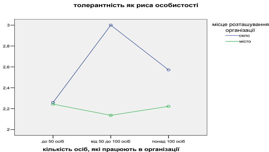
Рис. 1. Вплив чинників «кількість осіб, які працюють в організації» та «місце розташування організації» на рівень толерантності як риси особистості персоналу закладів освіти ( p < 0,05 )

Як видно з рис. 1 , констатовано сукупний вплив чинників «кількість осіб, які працюють в організації» та «місце розташування організації» на рівень толерантності як риси особистості педагогів. Дійсно, якщо зі збільшенням кількості працюючих в міських навчальних закладах цей показник толерантності залишається практично незмінним, то в сільських школах він досягає максимуму при кількості працюючих осіб від 50 до 100, після чого суттєво знижується.