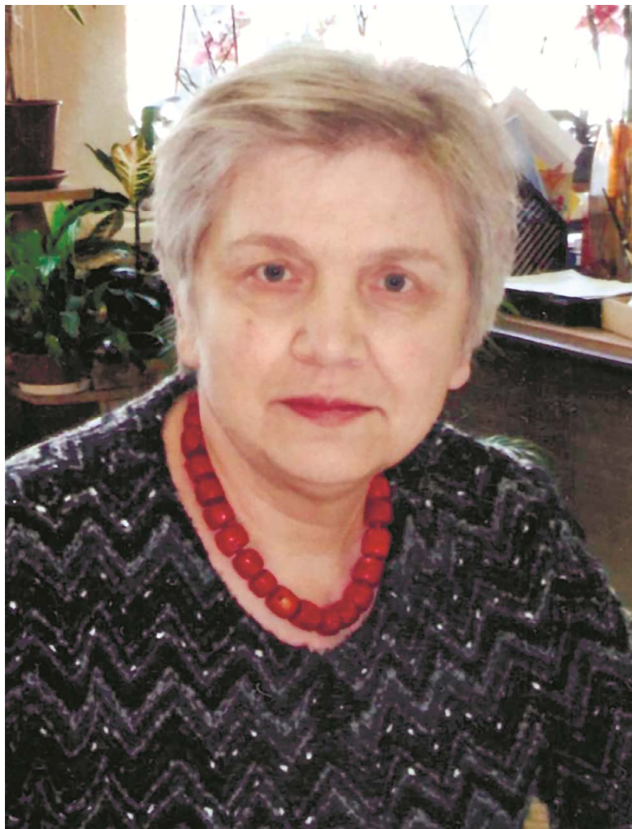
Ольга Василівна Сухомлинська