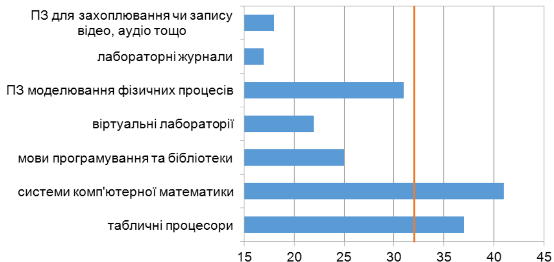
Рис. 4. Засоби ІКТ формування здатності проводити обчислювальні експерименти

Оцінюючи придатність різних засобів ІКТ для формування здатності проводити обчислювальні експерименти (рис. 4), експерти виокремили системи комп'ютерної математики та табличні процесори як провідні, а ПЗ моделювання фізичних процесів, мови програмування та бібліотеки, віртуальні лабораторії, ПЗ для захоплювання чи запису відео, аудіо тощо та лабораторні журнали як допоміжні.