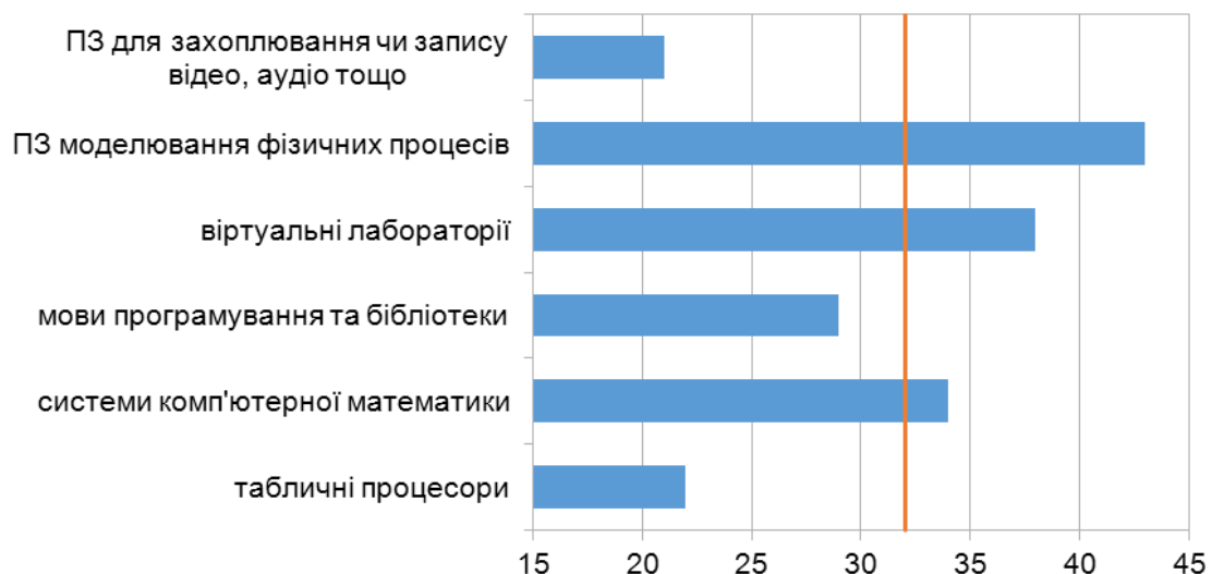
Рис. 3. ПЗ формування здатності користуватися засобами ІКТ для моделювання

Найбільш придатними для формування здатності користуватися засобами ІКТ для моделювання, на думку експертів (рис. 3), є: ПЗ моделювання фізичних процесів, віртуальні лабораторії та системи комп'ютерної математики. Допоміжними засобами були визначені мови програмування та бібліотеки, табличні процесори та ПЗ для захоплення чи запису відео, аудіо тощо.