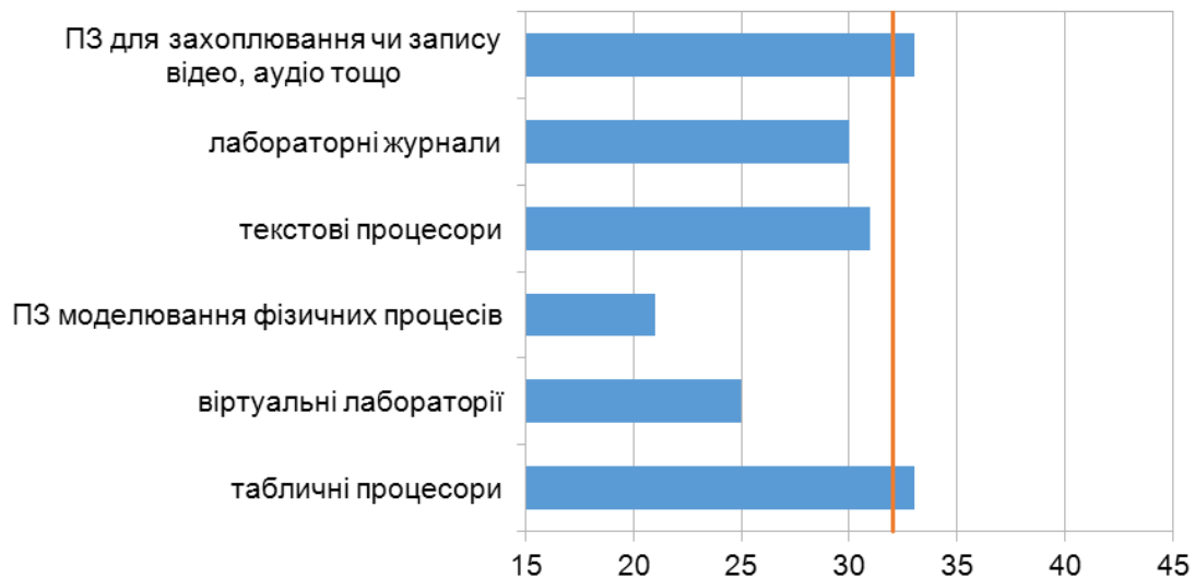
Рис. 2. Засоби ІКТ для фіксування перебігу дослідження

електронні лабораторні журнали доцільно використовувати за умови застосування відповідних ІКТ опрацювання та презентації перебігу та результатів дослідження.