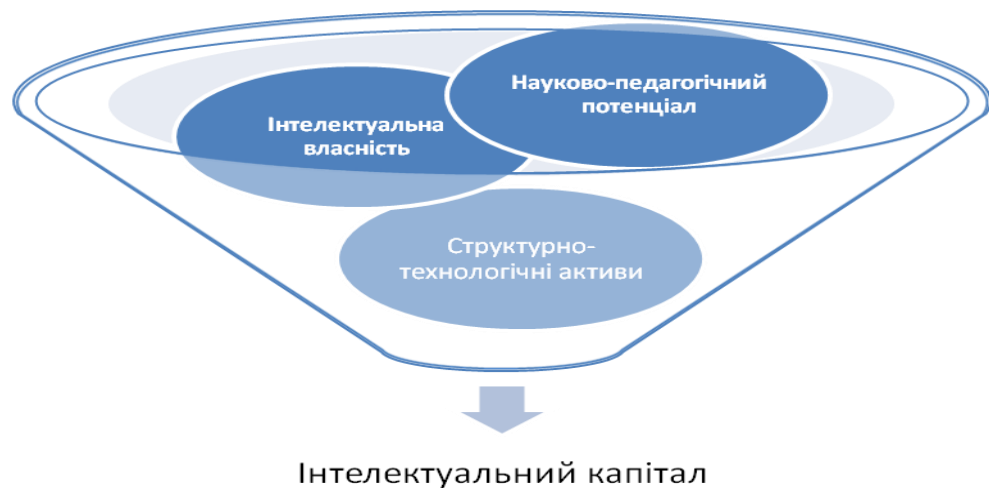
Рис. 3. Структурна організація інтелектуального капіталу навчальних закладів системи післядипломної педагогічної освіти

На нашу думку, розширення поняття «інтелектуальний капітал» до рівня всієї сукупності «невловимих активів» з урахуванням специфіки нашого дослідження невиправдане, оскільки розмивається така найважливіша характеристика інтелектуального капіталу, як його керованість відомими в менеджменті методами. Водночас має право на існування термін «нематеріальні активи», який використовується в описі процесів управління знаннями в контексті розуміння як такого, що перетворюється на інтелектуальний капітал і дає організаціям нову вартість.