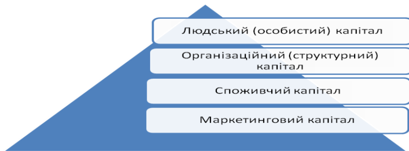
Рис. 2. Піраміда інтелектуального капіталу навчальних закладів

Здатність навчальних закладів системи ППО до накопичення й ефективного використання інтелектуального капіталу визначає розвиток цих закладів на основі переходу до вищого технологічного укладу. Завдання, що постають перед навчальними закладами системи ПО, полягають у реальній зміні моделі їх розвитку, яка має ґрунтуватися на накопиченні інтелектуального капіталу як підґрунтя формування інтелектуального потенціалу. Ефективне використання інтелектуального капіталу визначає можливості сталого розвитку та конкурентоспроможність науково-педагогічних працівників на освітньому ринку праці.