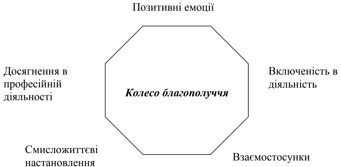
Рис.2 Колесо благополуччя Мартіна Селігмана

описують п'ятьма гранями людського буття (рис.2).