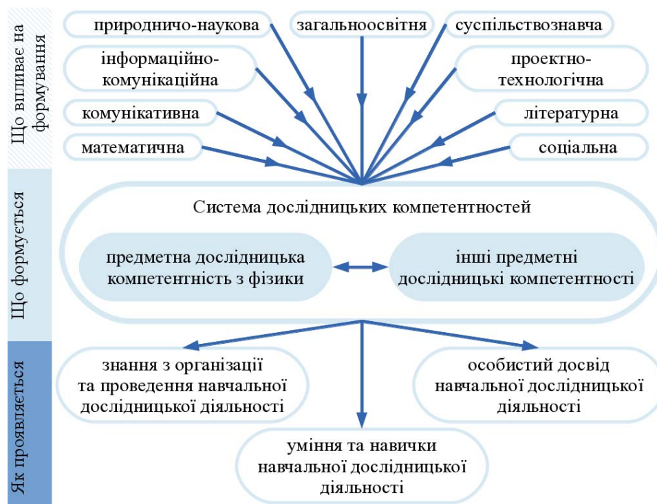
Рис. 3. Орієнтовна модель системи формування дослідницьких компетентностей учнів старших класів