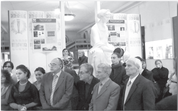
Виставка у Будинку вчителя на відзначення 110-ї річниці від дня народження