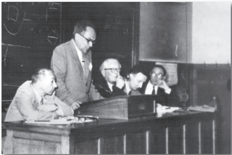
VI Міжнародний психологічний конгрес (Брюссель, 1957 р.)