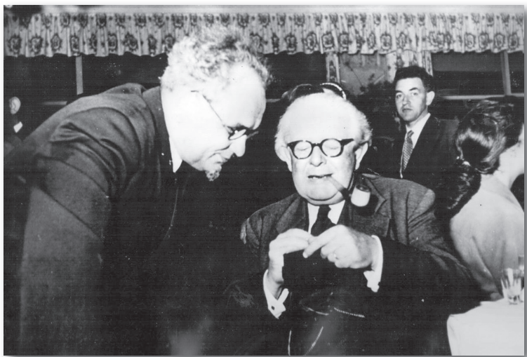
Григорій Силович Костюк, Жан П'яже (VIII Міжнародний психологічний конгрес, Москва)