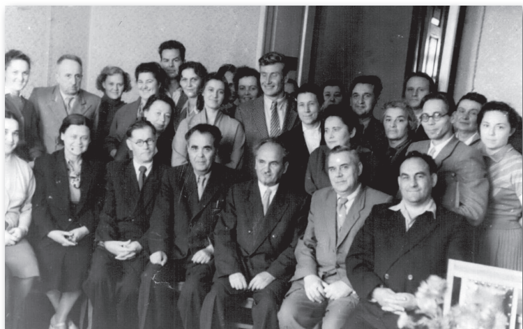
Перші науковці Інституту психології