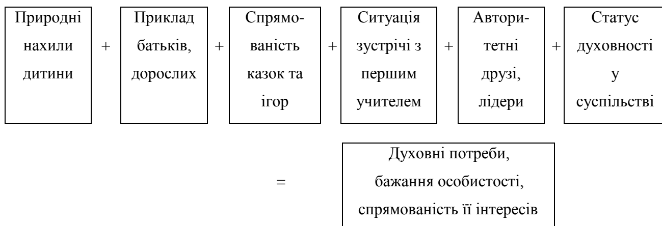
Рис. 1. Соціально-психологічні фактори, що впливають на духовне становлення молоді.

Вже з перших років життя ми можемо спостерігати різницю в активності дітей, їх темпераменті. Природні задатки поступово збагачуються соціальним досвідом і можуть розглядатися як сукупність певних передумов, що детермінують інтерес до внутрішнього світу, до процесу духовного зростання. Деякі діти виявляють інтерес до людей, гуманістичну та естетичну спрямованість. Ці характеристики мають бути виявлені та враховані як вихідні для подальшого духовного розвитку дитини.