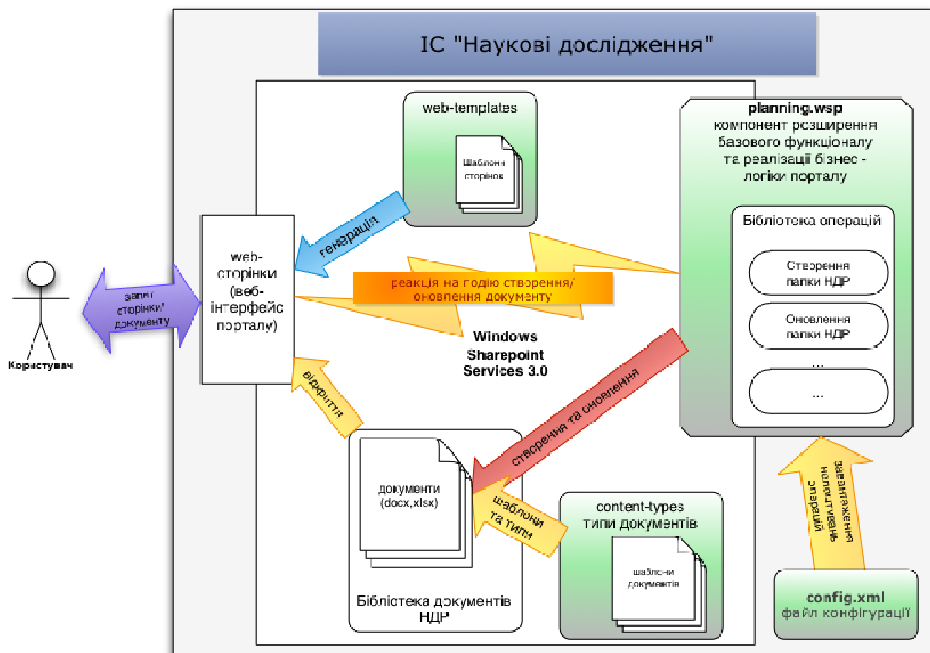
Рис. 4. Взаємодія компонент програмного забезпечення ІС «Наукові дослідження»