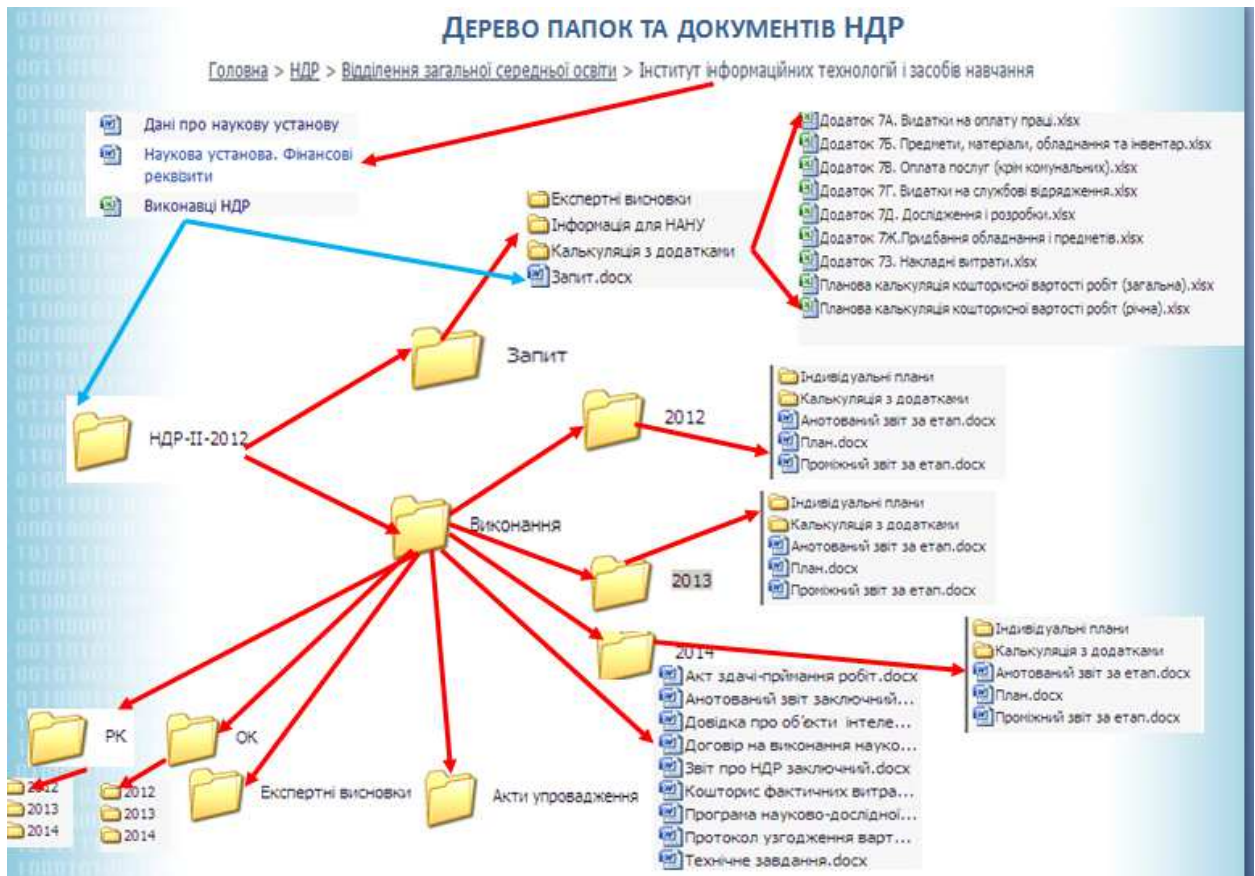
Рис. 3. Дерево папок і документів НДР

Компонент автоматичної ініціалізації дерева каталогів та документів створює структуру папок і формує комплект документів для кожної НДР згідно схеми, представленої на рис. 3.