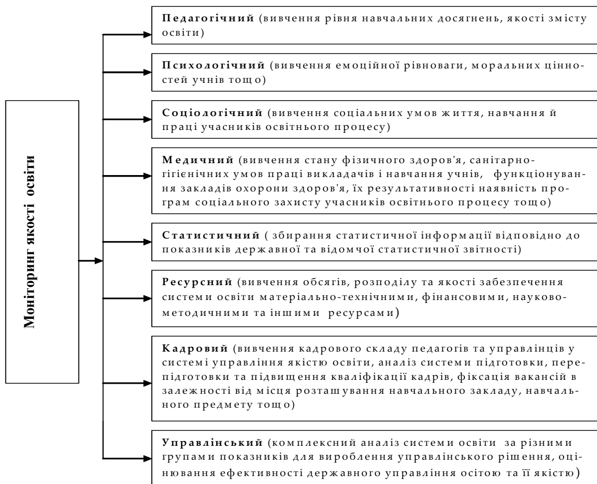
Рис. 2. Основні напрями досліджень в структурі комплексного моніторингу якості освіти [3, с. 88].

проведенні – педагогічний; соціологічний; психологічний; медичний; економічний; демографічний.