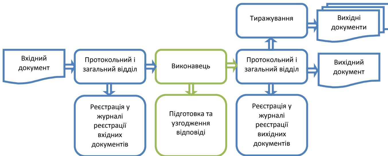
Рис. 1. Структурна схема зовнішнього документообігу в науковій установі

Суб'єктами зовнішнього документообігу НАПН України виступають структурні підрозділи апарату Президії НАПН України, підвідомчі установи, органи виконавчої влади, Верховна Рада України та інші організації, які або яким надсилають кореспонденцію.