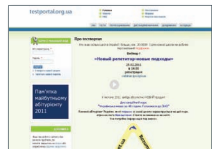
Місія сайту сьогодні – пошук інноваційних освітніх технологій та надання простих механізмів їх практичної апробації

Зараз місія сайту змінюється і, якщо коротко, то сформулювати її можна як «Пошук інноваційних освітніх технологій та надання простих механізмів