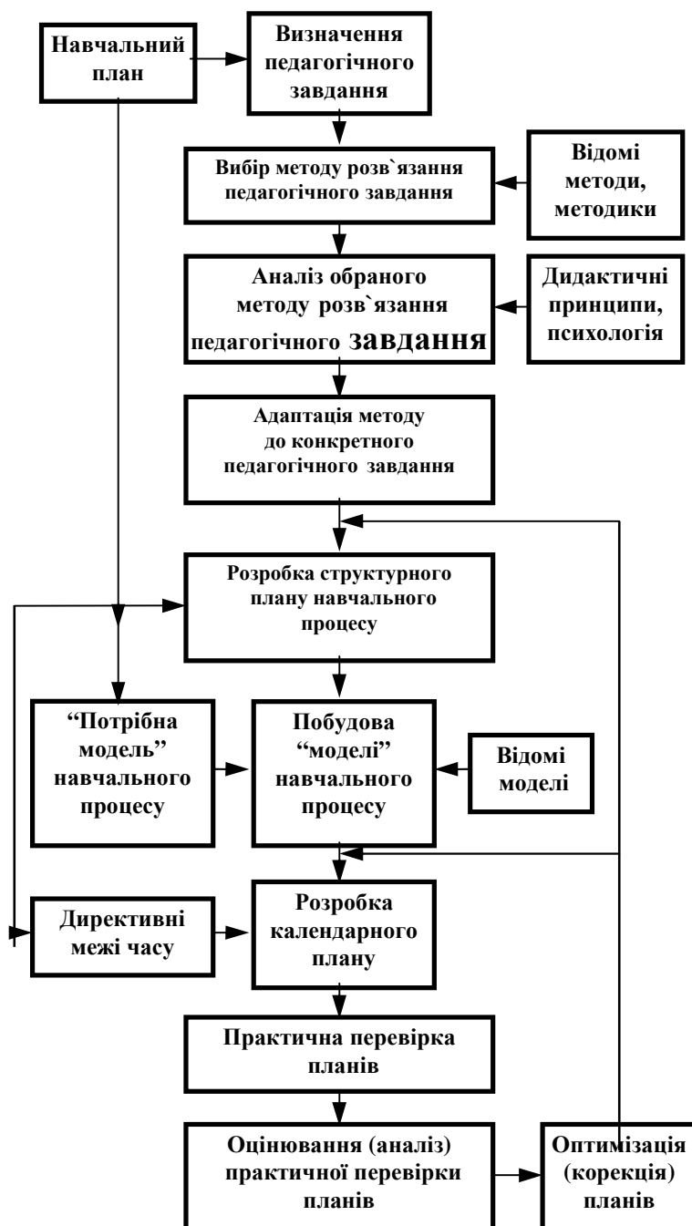
Мал. 1. Узагальнена структура процесу педагогічного проектування.

розгортається низка навчальних подій, урахування підготовленості учнівської аудиторії до виконання завдань, які планується вирішити, форм та методів формування проблемної ситуації, яка націлює учня на виконання завдань дослідження, форм та методів оцінювання навчальної діяльності тощо [1, 2].