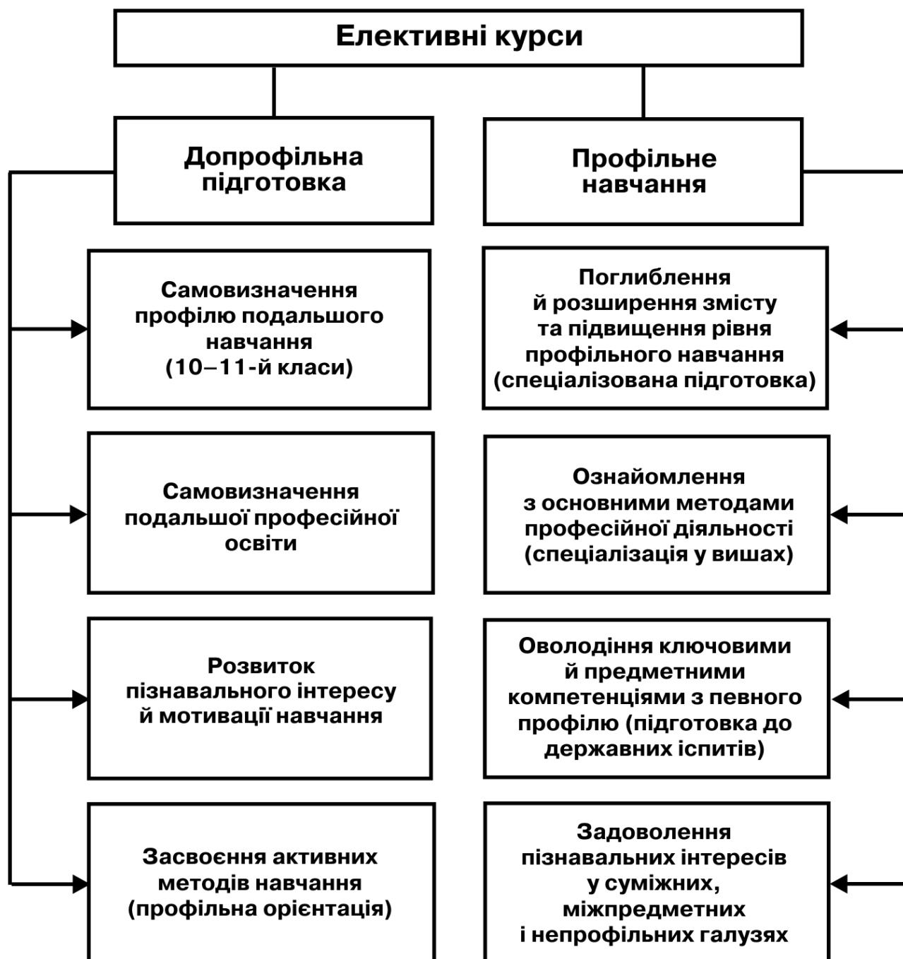
Рис. 2. Типи елективних курсів

Зміст сучасної фізичної освіти розглядається як сукупність знанневого й діяльнісного компонентів з превалюванням останнього, спрямованого на конкретний суб'єкт навчання або категорію учнів. Відповідно змінюються й завдання навчання, для розв'язання яких запроваджують такі типи елективних курсів за вибором – допрофільна підготовка й профільне навчання (рис. 2).