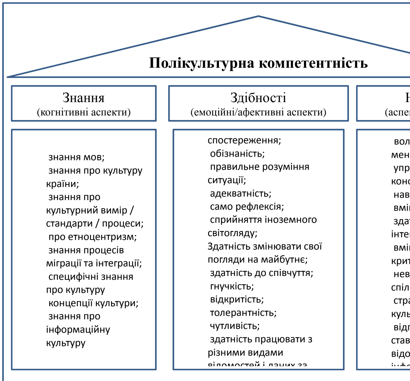
Рис. 1. Структура полікультурної компетентності

Важливим постає завдання щодо створення такого освітнього середовища, яке б сприяло формуванню полікультурної свідомості та поведінки учнів в умовах інформаційного суспільства. З огляду на це слід проаналізувати можливості сучасних ІКТ та інноваційні педагогічні ідеї, які є необхідними для створення такого середовища.