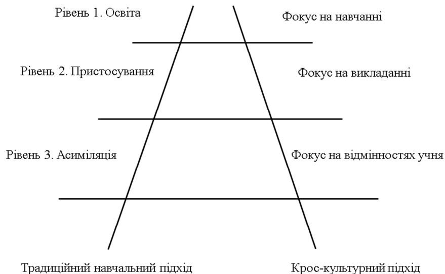
Рис. 2. Крос-культурні сходинки викладання (адаптовано за Дж. Бігсом [13, с.375])

До сучасної стратегії полікультурної освіти відноситься концепція Дж. Бігса “крос-культурні сходинки викладання” (англ., cross-cultural teaching ladder ) [13]. Дослідник зазначає, що іноземні учні під час навчання можуть зіткнутися з трьома проблемами: соціокультурна адаптація, мовні проблеми та проблеми викладання/навчання. Метафора “крос-культурні сходинки викладання” є концепцією викладання, яка допомагає уникнути цих проблем у навчально-виховного процесі в полікультурному класі (рис.2).