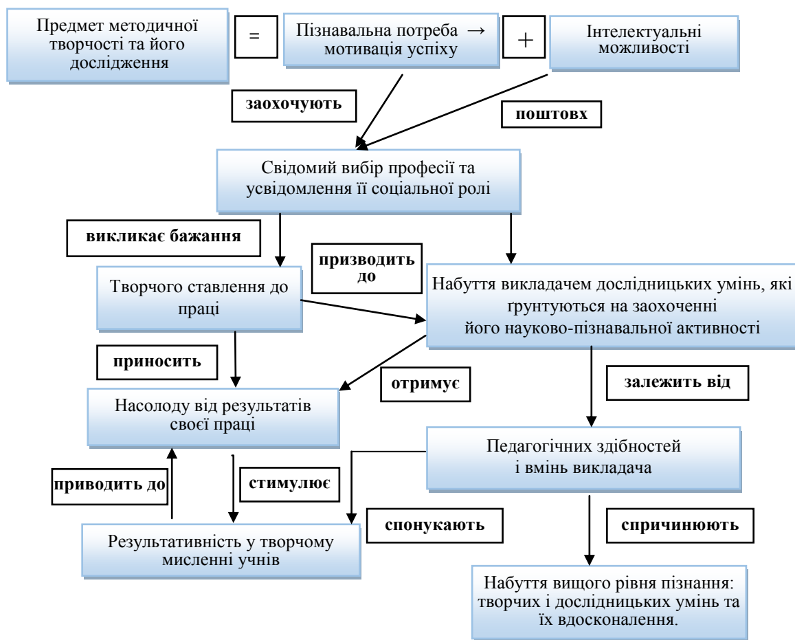
Рис. 1. Структура становлення творчої особистості викладача ПТНЗ

Елементи акторського мистецтва у педагогічній діяльності викладача або так званий «артистизм» Д. Белухін [1], О. Булатова [2], О. Головенко [5] і О. Ковальчук [12] презентують як здатність яскраво-виразної передачі педагогічно доцільної емоції чи почуття, уміння персоналізовано уособлювати думку в образах, діях, словах, позиції.