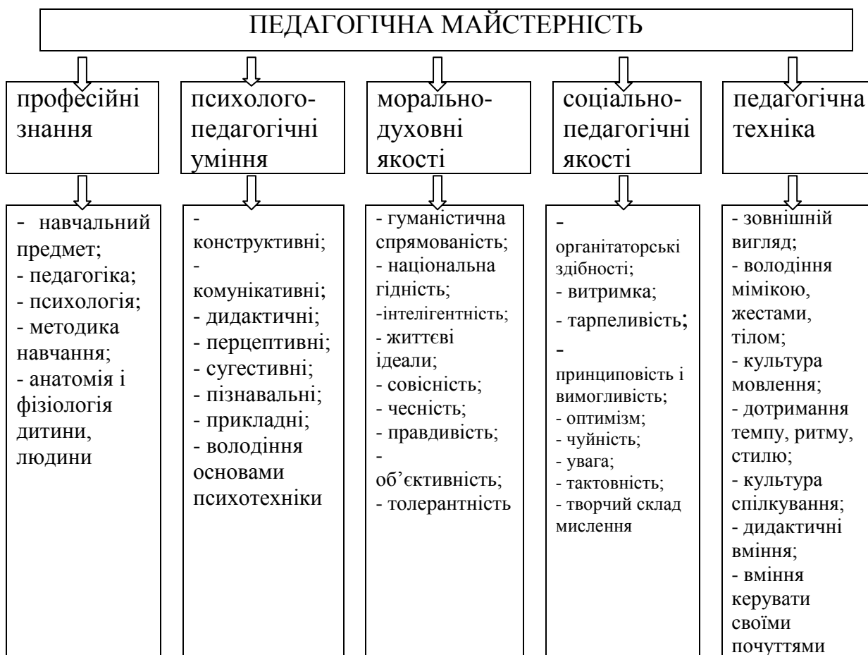
Схема 1.1.1 Складові педагогічної майстерності

Із викладеного можна зробити висновок, що педагогічна майстерність викладача будь-якої дисципліни потребує таких складових (схема 1.1.1):