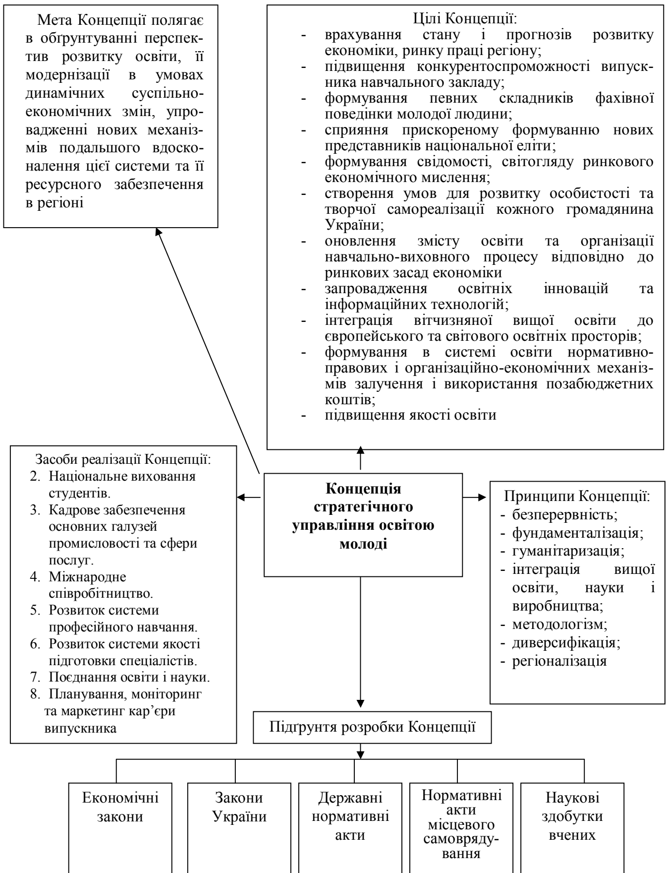
Рис. 3. Основні складові Концепції стратегічного управління економічною освітою молоді в регіоні