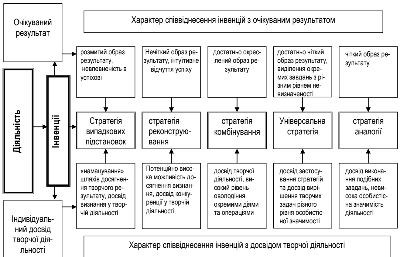
Рис. 2. Особливості включення інвенцій у творчу діяльність

Накопичений досвід і здатність прогнозувати результат – ці дві особливості людини як суб'єкта творчого процесу лягли в основу пропонованої нами моделі включення інвенцій у творчу діяльність (рис.2.).