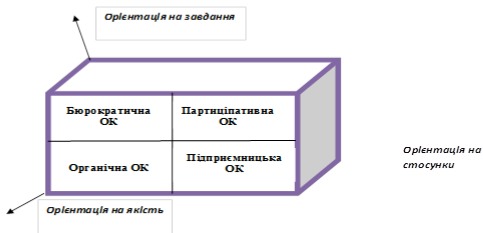
Рис. 3. Типи організаційної культури за Д. Коулом [18]

У свою чергу, Д. Коул [18] на основі таких критеріїв, як орієнтація на задачу, орієнтація на стосунки та орієнтація на якість, виділив чотири типи організаційної культури: 1) бюрократична; 2) органічна; 3) підприємницька; 4) партиципативна (рис. 3).