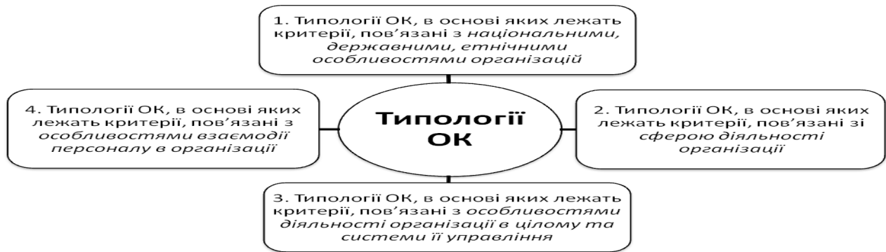
Рис. 1. Класифікація типологій організаційної культури (ОК)

4. Типології організаційної культури, в основі яких лежать критерії, пов'язані з особливостями взаємодії персоналу в організації .