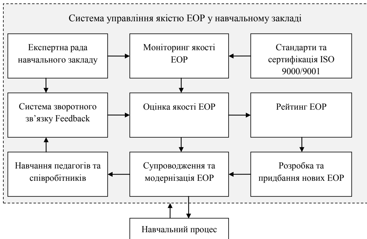
Рис 2. Структура системи управління якістю ЕОР

Структура системи управління якістю ЕОР представлена на рис 2. Згідно з наведеною структурою СУЯ ЕОР процес управління якістю електронних ресурсів навчання складається з комплексу наступних взаємопов'язаних заходів. Проведення моніторингу якості ЕОР є основним чинником контролю якості, визначаючи, насамперед, ступінь відповідності ЕОР освітнім стандартам. Важливим критерієм оцінювання якості ЕОР є ступінь задоволеності користувачів цих ресурсів навчання. Експертна рада навчального закладу керує роботою з проведення моніторингу якості ЕОР та аналізу результатів анкетування учнів і педагогів за програмою Feedback, визначаючи критерії оцінювання ЕОР. Сертифікація ЕОР за стандартом ISO 9000/9001 може служити оцінкою високої якості. Разом з тим, вимоги і рекомендації цих стандартів можуть служити критеріями оцінювання якості ЕОР. Оцінювання якості ЕОР є інструментом поліпшення споживчих характеристик цих ресурсів, визначаючи напрями досліджень при супроводі й розробці (придбанні) нових електронних ресурсів навчання. Ознайомлення професорсько-викладацького складу НЗ з рейтингом ЕОР сприяє підвищенню мотивації викладачів до використання якісних ресурсів та оволодіння новими інформаційними технологіями навчання.