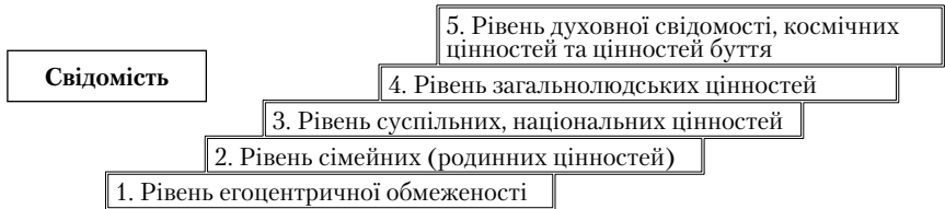
Рис. 4.1. Рівні розвитку свідомості особистості

Розвиток свідомості пов'язаний з трансформацією домінантних потреб і цінностей людини від нижчих до вищих. На думку багатьох вчених (Л. Колберг, Ж. Піаже, Г. Сковорода), людська свідомість розвивається від першого рівня — егоцентричного — до найвищого рівня духовних цінностей (Рис. 4.1).