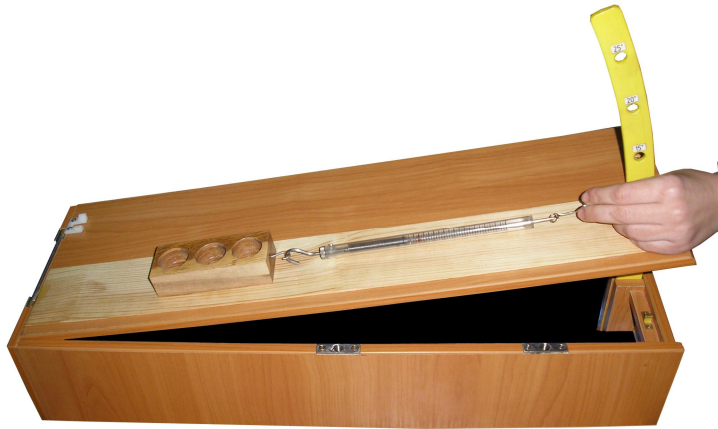
Рис. 4. Приклад установки для дослідження сили тертя

Під час розв'язування багатьох якісних задач припускають застосування методу дослідницького експерименту. Прикладом може бути видозмінена задача зі збірника задач з фізики для середньої школи [10, № 257]. Ми пропонуємо дослідити рух повітряного пухирця в трубці з рідиною. Трубка може бути розташована як вертикально (рис. 5.), так і під кутом до горизонту (рис. 6.).