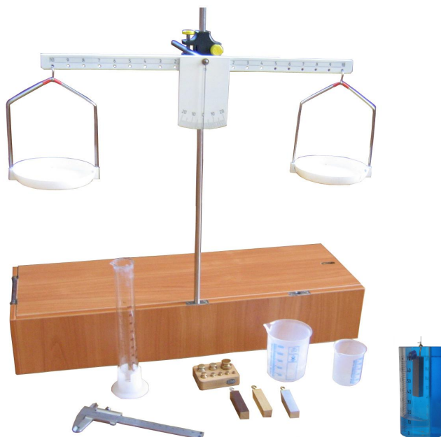
Рис. 2. Установка до лабораторної роботи 7 класу «Визначення густини твердих тіл та рідин»

матеріалу, лабораторна робота 8 класу «Дослідження коливань маятника», або під час закріплення матеріалу, лабораторна робота 8 класу «Конструювання динамометра» (рис. 3)), а також на факультативах, під час розв'язування експериментальних творчих завдань.