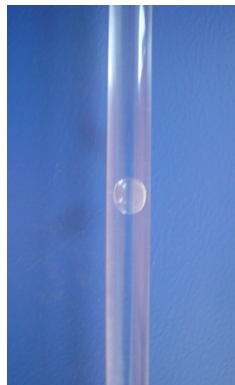
Рис. 5. Установка для дослідження руху повітряного пухирця в трубці з рідиною (вертикальне положення трубки)

Під час розв'язування багатьох якісних задач припускають застосування методу дослідницького експерименту. Прикладом може бути видозмінена задача зі збірника задач з фізики для середньої школи [10, № 257]. Ми пропонуємо дослідити рух повітряного пухирця в трубці з рідиною. Трубка може бути розташована як вертикально (рис. 5.), так і під кутом до горизонту (рис. 6.).