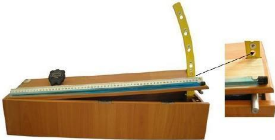
Рис. 6. Установка для дослідження руху повітряного пухирця в трубці з рідиною (трубка розташована під кутом до горизонту )

Експериментальна апробація комплекту «Механіка» в пілотних загальноосвітніх навчальних закладах м. Суми підтвердила його дидактичні переваги порівняно з існуючими в середній школі наборами засобів навчання, призначених для виконання фронтальних лабораторних робіт і робіт фізичного практикуму.