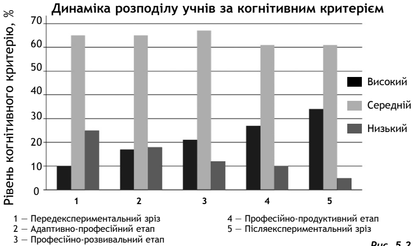
Рис. 5.2. Гістограма поділу учнів за когнітивним рівнем готовності до професійної діяльності

сійної діяльності подаємо на рис. 5.2. У табл. 5.8 (див. с. 258) можна простежити динаміку змін одержаних достовірних результатів оцінювання значень показників когнітивного критерію готовності учнів до професійної діяльності за обраним фахом в експериментальних і контрольних групах протягом 2003-2008 рр.