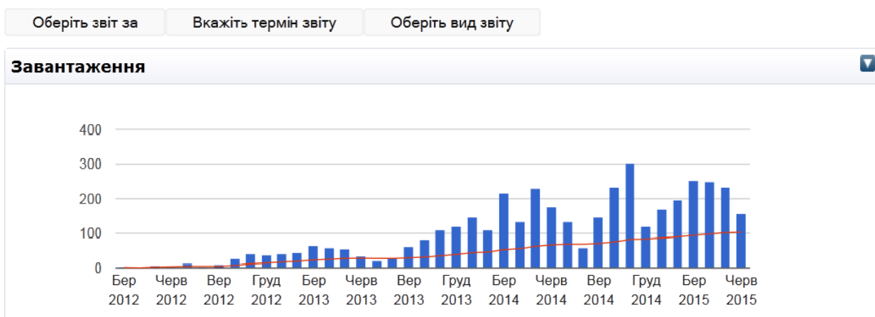
Рис.3. Приклад завантаження інформаційних ресурсів за науковою темою за 2012-2015 рр.

0112U000283 (2012-2014) The system of scientific and technological development of the electronic network of libraries in the system of NAPS of Ukraine