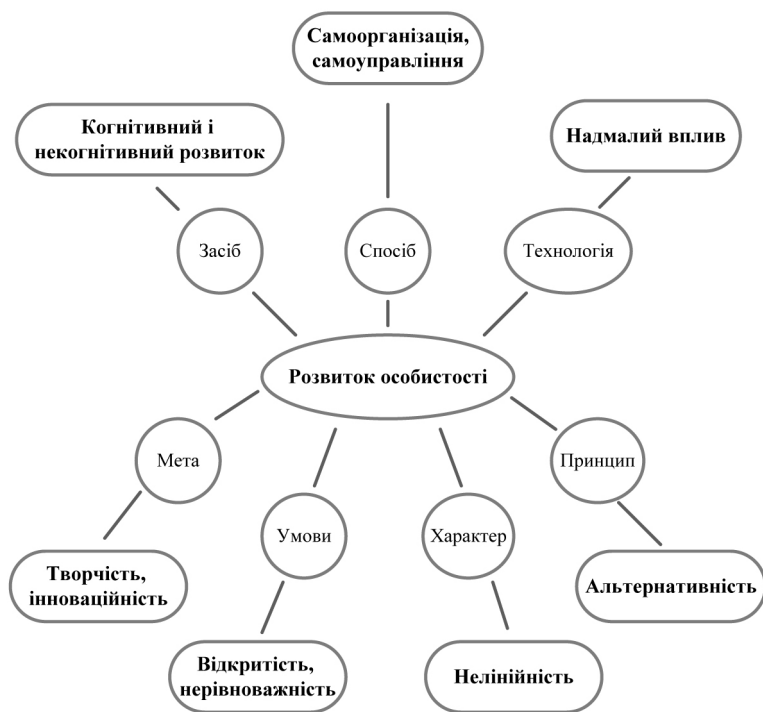
Рис. 1. Параметри розвитку особистості в синергетичному підході

Основні параметри розвитку особистості в синергетичному підході, які має неодмінно враховувати соціалізатор (викладач, вихователь), можна схематично позначити наступним чином (рис. 1).