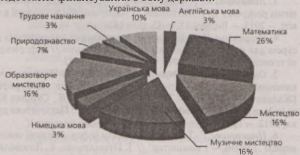
Рис. 1. Розподіл ЕОР навчального призначення для учнів молодших класів, які отримали гриф МОН у період із січня 2006 року до вересня 2010 року.

Таким чином, можна зробити висновок, що на той час питання створення ЕОР навчального призначення для учнів молодших класів було не на часі через недостатнє матеріально-технічне забезпечення початкової школи та недостатнє фінансування з боку держави.