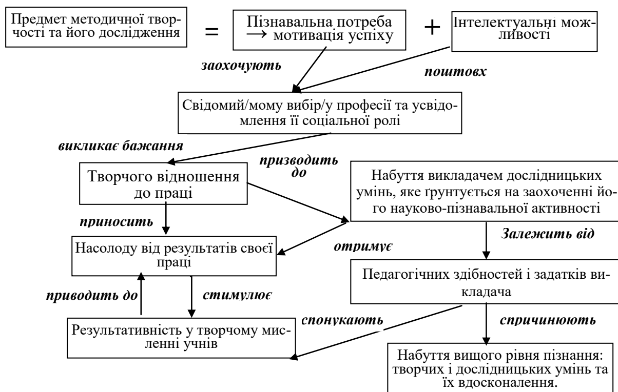
Рис. 1. Структура становлення творчої особистості викладача ПТНЗ

ливостей, які, безумовно, дадуть поштовх до наукового пошуку. Якщо зобразити це графічно, то отримаємо (рис. 1):