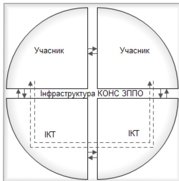
Рис. 1. Взаємозв'язки компонентів і учасників комп'ютерно орієнтованого навчального середовища закладу післядипломної педагогічної освіти

Оскільки «комп'ютерно орієнтоване навчальне середовище закладу післядипломної педагогічної освіти – керований, штучно і цілеспрямовано побудований простір, у якому розгортається навчально-пізнавальний процес з використанням інформаційно-комунікаційних технологій (ІКТ) і в якому створені необхідні та достатні умови для його учасників щодо ефективного здійснення підвищення кваліфікації педагогічних кадрів», тому охарактеризуємо взаємозв'язки між учасниками КОНС ЗППО та інформаційно-комунікаційними технологіями (рис. 1).