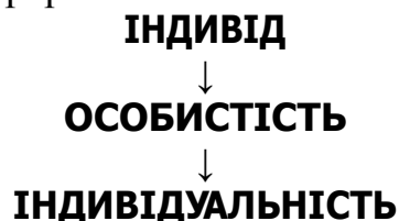
Рис. 2 Ієрархічні зв'язки індивід-особистість-індивідуальність [2]

Б.Г.Ананьєв вважав, що основою індивідуальності є неповторний комплекс певних природних властивостей індивіда. Хоча, за його словами: «не всякий індивід є індивідуальністю». Щоб стати індивідуальністю індивід повинен стати особистістю. Ієрархічні зв'язки можна представити (рис.2).