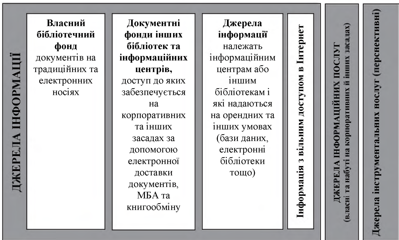
Рис. 1. Структура бібліотечно-інформаційного ресурсу

Третій аспект. Доведено, що в сучасних умовах забезпечення рівного доступу до інформації для всіх учасників освітнього процесу, незалежно від їхнього статусу й місцезнаходження, можливе лише в результаті створення інтегрованого галузевого інформаційного ресурсу, принципи і практичні шляхи створення якого нині розробляє колектив науковців ДНПБ України ім. В. О. Сухомлинського.