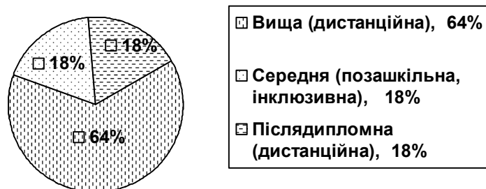
Рис. 1. Розподіл незавершених дисертаційних робіт за рівнем організації педагогічного процесу.

На рис.2 представлено процентне співвідношення охоплення дисертаційними роботами здобувачів наукових ступенів, які захистили дисертації в 2011-2012 рр. у спеціалізованій вченій раді Інституту. Розподіл здійснено за рівнем організації педагогічного процесу.