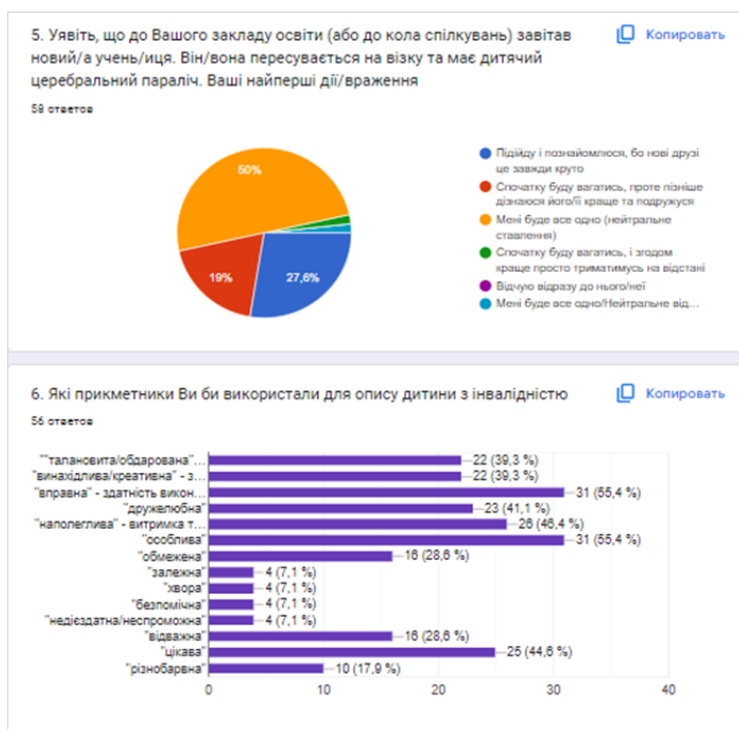
Рис. 2. Почуття при зустрічі з дитиною з інвалідністю.