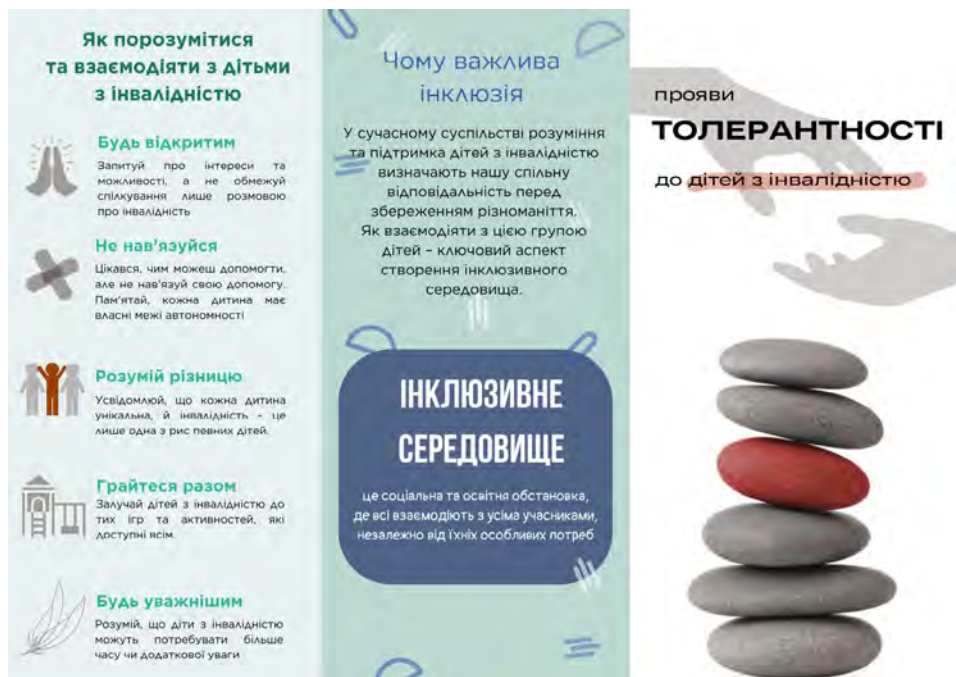
Рис. 3. Буклет (автор Є. Мельничук)

За результатами нашого дослідження створено буклет (Рисунок 3. Буклет) для поширення інформації й порад щодо толерантної комунікації з дітьми з інвалідністю. Буклет поширений у соціальних мережах, зокрема за посиланням https://x.com/likskyl/status/1750614936902852609?s=20 .