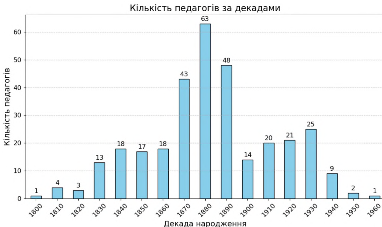
Рис. 1 Гістограма народження персоналій енциклопедичного біографічного словника «Педагоги України (друга половина XIX – початок XXI ст.).

Подаємо хронологію народження персоналій за декадами у формі гістограми (Рис. 1).