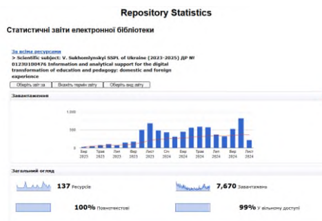
Рис. 1. Динаміка затребуваності наукового доробку за темою «Інформаційно-аналітичний супровід цифрової трансформації освіти і педагогіки: вітчизняний і зарубіжний досвід» (2023–2025) (дані ЕБ НАПН України на 07.11.2024 р.)

дослідження шляхом організації і проведення наукових заходів за таким спрямуванням, як: адаптивні процеси інформаційно-аналітичного забезпечення цифрової трансформації освіти і педагогіки 1 , розбудова єдиного відкритого інформаційного простору освіти впродовж життя 2 та ін., участі у міжнародних освітянських виставках «Сучасні заклади освіти 2024» (нагороджено ДНПБ Золотою медаллю виставки та відзначено відповідною сертифікацією) й «Освіта та кар'єра. День студента 2024»; забезпечення підтримки профілю відділу наукового інформаційно-аналітичного супроводу освіти в Google Scholar (h=22) 3 , Ютуб-каналу ВНІАСО 4 ; ORCID ВНІАСО 5 , у статтях ЗМІ, а також розміщено проміжні та поточні результати наукового дослідження в репозиторії Електронної бібліотеки НАПН України 6 (рис. 1), укладено договори з освітніми партнерами про спільну діяльність, результати презентовано на всеукраїнських, міжнародних, зокрема закордонних заходах (Естонія, Італія, Німеччина, Польща, США, Туреччина та ін.).