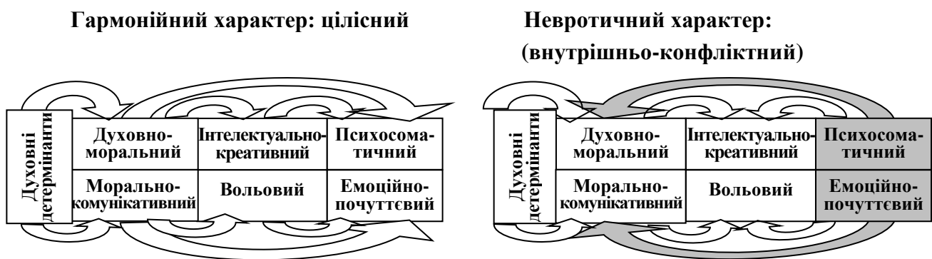
Рис. 3. Схема взаємозв'язків між компонентами характеру особистості (розробка автора). Умовні позначення: \Rightarrow - позитивна кореляція; \Rightarrow - негативна кореляція.

духовного потенціалу особистості всі компоненти характеру позитивно корелюють між собою. А в структурі невротичного характеру існує внутрішній конфлікт між духовно-моральним, морально-комунікативним компонентами, з одного боку, і психосоматичним та емоційно-почуттєвим компонентами, з іншого боку (психосоматичні та емоційно-почуттєві риси ніби протистояють розвитку духовно-моральних якостей) (рис. 3). Для конструктивного розв'язання цього протиріччя доцільно використовувати інтелектуально-креативний і вольовий компоненти як посередників, адже вони мають позитивні кореляції як з духовно-моральним, морально-комунікативним компонентами, так і з емоційно-почуттєвим та психосоматичним компонентами.