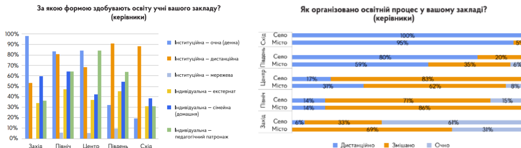
Рис.1. Розподіл форм організації освітнього процесу за регіонами й типом населеного пункту[1, 14-15]

За даними Державної служби якості освіти України [1] суттєвих змін зазнали форми здобуття освіти. Якщо у 2021–2022 н.р. переважна більшість учнів в Україні (97,55 %) здобувала середню освіту за очною формою, то внаслідок військової агресії та вимушеного переміщення українців як в межах країни, так і за кордон, частка учнів, які здобувають середню освіту очно, зменшилася до 77,36 %. Водночас в умовах війни у 43 рази збільшилася кількість учнів/учениць, які здобувають освіту за дистанційною формою: з 17 669 (0,41 %) до 772 909 (18,88%) учнів. З огляду на постійну загрозу безпеці учасників освітнього процесу, лише 15 % закладів освіти у першому півріччі 2022/2023 н.р. працювали очно, 33 % – дистанційно, 51 % – змішано, поєднуючи очне та дистанційне навчання. Водночас організація освітнього процесу в різних регіонах України відрізняється. В східних регіонах переважна більшість закладів освіти працюють дистанційно, що зумовлено насамперед безпековою ситуацією. В південних також переважає дистанційне навчання, однак близько третини закладів у містах навчаються змішано (частково дистанційно, частково очно). В центральних та північних областях України переважає змішане навчання. На заході – переважно очне навчання.