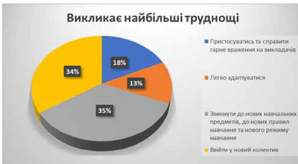
Рис. 2. Результати анкетування здобувачів освіти I курсу 2023–2024 н.р. щодо труднощів адаптації

Проведені анкетування й опрацьовані їхні результати дають змогу педагогічному колективу обрати відповідні форми й методи організації освітнього простору, що сприятимуть адаптації здобувачів освіти до умов освітнього середовища ЗПО й подальшої їхньої адаптації на ринку праці.