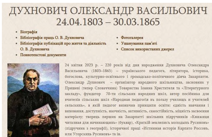
Рис. 1. Сторінка «Духнович Олександр Васильович» ( http://dnpb.gov.ua/ua/informat-siyno-bibliografichni-resursy/vydatni-pedahohy/dukhnovych-o-v/ )

Вебсторінку «Духнович Олександр Васильович» створено в 2013 р. З того часу її систематично поповнювали новою актуальною інформацією. Цьогоріч у межах виконання наукового дослідження «Педагогічна біографіка в інформаційному науково-освітньому просторі України» (2023–2025 рр., науковий керівник – професор Л. Д. Березівська) удосконалено структуру і розширено зміст сторінки. Її впорядковано за окремими тематичними рубриками, в яких систематизовано відповідний інформаційний контент.