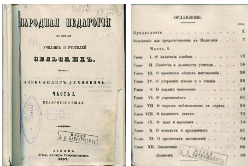
Рис. 2. Праця О. В. Духновича «Народная педагогія въ пользу училищъ и учителей сельскихъ. Часть 1. Педагогія общая», 1857 р. ( http://194.44.28.246/dcvisu/documents/visu/268 )

Рубрика «Повнотекстові документи» містить цифрові копії окремих педагогічних творів О. В. Духновича. Зокрема, тут можна побачити перший у Західній Україні підручник з педагогіки для народних учителів «Народная педагогія въ пользу училищъ и учителей сельскихъ. Часть 1. Педагогія общая», видана у Львові 1857 р. Праця зберігається у фонді ДНПБ, а її цифрова копія доступна в електронній бібліотеці установи ( http://194.44.28.246/dcvisu/documents/visu/268 ). «Народная педагогія...» становить 12 глав, у яких автор говорить про якості та завдання вчителя, шкільний порядок, організацію навчального процесу тощо (Духнович, 1857). Також у рубриці представлено уривки із зазначеної праці вченого, розміщені в хрестоматії «Педагогіка» ( http://dnpb.gov.ua/ua/informatsiyno-bibliohrafichni-resursy/vydatni-pedahohy/dukhnovych-o-v/povnotekstovi-dokumenty/ ).