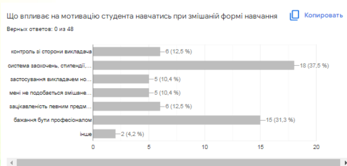
Рис. 2. Аналіз відповідей опитаних студентів

Результати відповідей представлені на рисунку 2. Проаналізувавши, автор відмічає, що для студентів найбільшою мотивацією є система заохочень від адміністрації, наприклад стипендії, але разом з тим, бажання бути професіоналом теж має високе значення для студентів. Але дослідження потребує подальшого аналізу та опитувань студентів та викладачів.