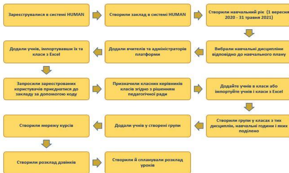
Рис. 3. План упровадження дистанційного навчання в КЗ «Малинівський ліцей № 2»

Зміст подальшої поточної роботи адміністратора полягав у наданні допомоги вчителям щодо наповнення їхніх курсів контентом. З цією метою було проведено 2 тренінги, під час яких учителі на практиці засвоїли роботу на платформі. Творчою групою була розроблена покрокова інструкція «Як розпочати роботу на платформі HUMAN Школа» (рисунок 3), були проведені тренінги, практичні заняття для набуття учителями навичок роботи з платформою. Крім того, розроблені пам'ятки для педагогів та учнів «Як підключитися до платформи HUMAN Школа».