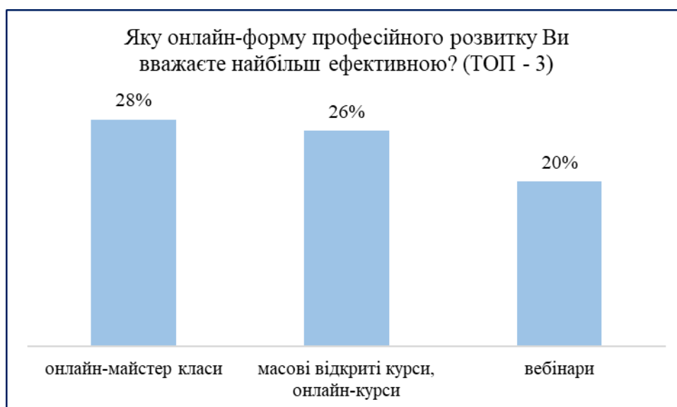
Рис.2. Розподіл відповідей респондентів на запитання «Яку онлайн-форму професійного розвитку Ви вважаєте найбільш ефективною?»

Найбільш ефективними онлайн-формами професійного розвитку педагогічні працівники вважають для себе такі (рис.2): онлайн-майстер класи – 27,8%; масові відкриті курси, онлайн-курси – 26,5%; вебінари – 20,2%; онлайн-конференції/семінари – 15,5%; онлайн-професійні конкурси – 7,3%; онлайн-проекти – 1,9%; інше – 0,6%.