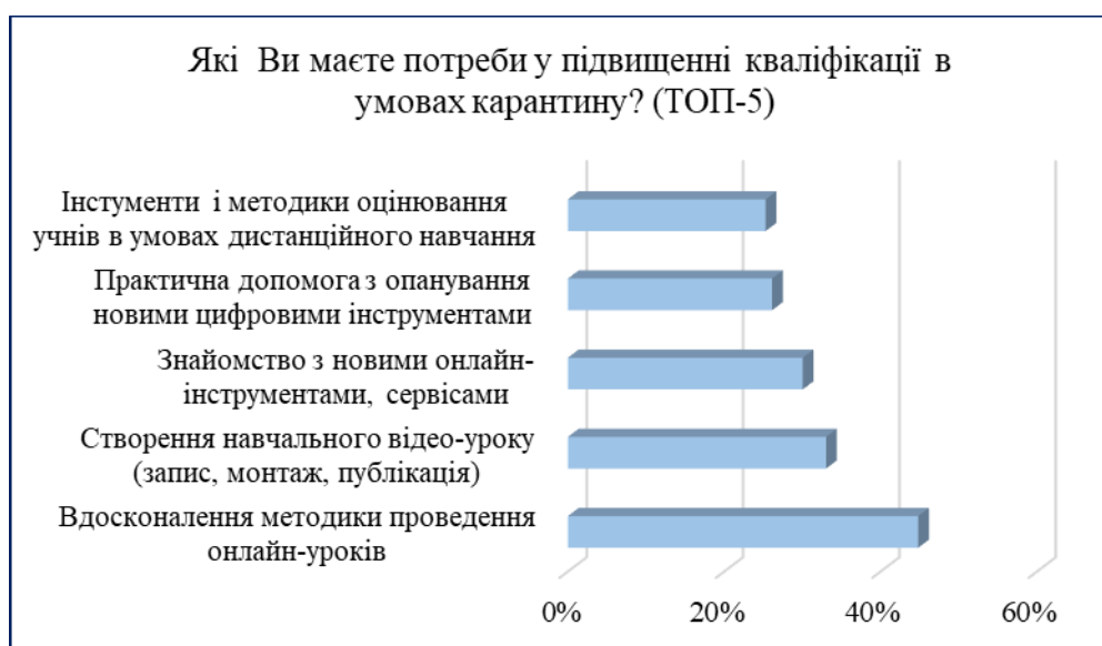
Рис.3. Розподіл відповідей респондентів на запитання «Які Ви маєте потреби у підвищенні кваліфікації в умовах карантину?»

Серед основних потреб у підвищенні кваліфікації респонденти вказали: удосконалення методики проведення онлайн-уроків – 45%; створення навчальних відео, запис і монтаж відеоуроку – 33,6%; знайомство з новими онлайн-інструментами та сервісами для учнівської творчості – 30,6%; практична допомога в опануванні новими інструментами – 26,6%; інструменти та методика оцінювання в умовах дистанційного навчання – 25,8%; курси для вчителів Нової української школи (НУШ) в основній школі – 23,4%; ознайомлення з новими онлайн-семінарами та практикумами (НУШ, тематичні сайти) – 22,2%; швидкі онлайн-консультації з питань використання ІКТ – 16,5%; забезпечення доступності до онлайн-курсів, вебінарів – 13,5%; курси для вчителів НУШ початкової школи – 12,8%; створення та підтримка власного блогу – 11,3%.