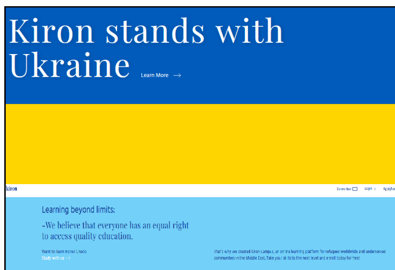
Рис.1 Відритий університет Kiron Campus .

Kiron Open Higher Education — громадська організація (Німеччина), що пропонує навчальні курси на базі MOOC для біженців та шукачів притулку з можливістю отримати визнання кредитів в університеті-партнері, відкриваючи таким чином шлях до університету. Вони пропонують гнучку комбінацію онлайн-самонавчання та онлайн-співробітництва. Такий підхід став досить затребуваним для біженців та шукачів притулку з академічним досвідом і хорошими навичками самостійного навчання (рис 1);