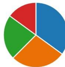
Діаграма 2. Негативні сторони дистанційного навчання

Після розгляду теоретичних концепцій зарубіжних авторів з організації дистанційної форми навчання, вчителями ліцею було визначено ті, які можливо реалізувати у старших класах закладу загальної середньої освіти (Діаграма 3).