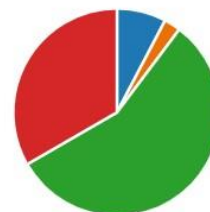
Діаграма 3. Добір теоретичних засад дистанційного навчання вчителями