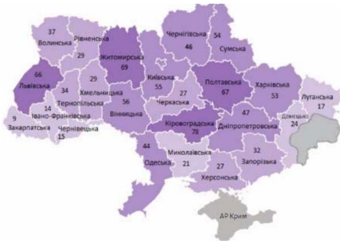
Рис. 2. Кількість опорних шкіл у областях України (станом на 24.07.2020 р.), одиниць (побудовано за даними Директорату шкільної освіти Міністерства освіти і науки України)

областях. У 2020 році з'явилися перші опорні заклади у Закарпатській області, яких на 27.07.2020 р. вже налічувалося 9 (рис.2).