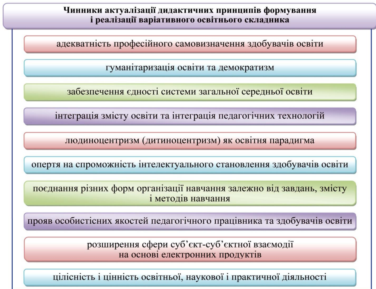
Рис. 1. Чинники актуалізації дидактичних принципів формування і реалізації варіативного освітнього складника

Актуальність дидактичних принципів формування і реалізації варіативного освітнього складника зумовлює низка чинників (Рис. 1).