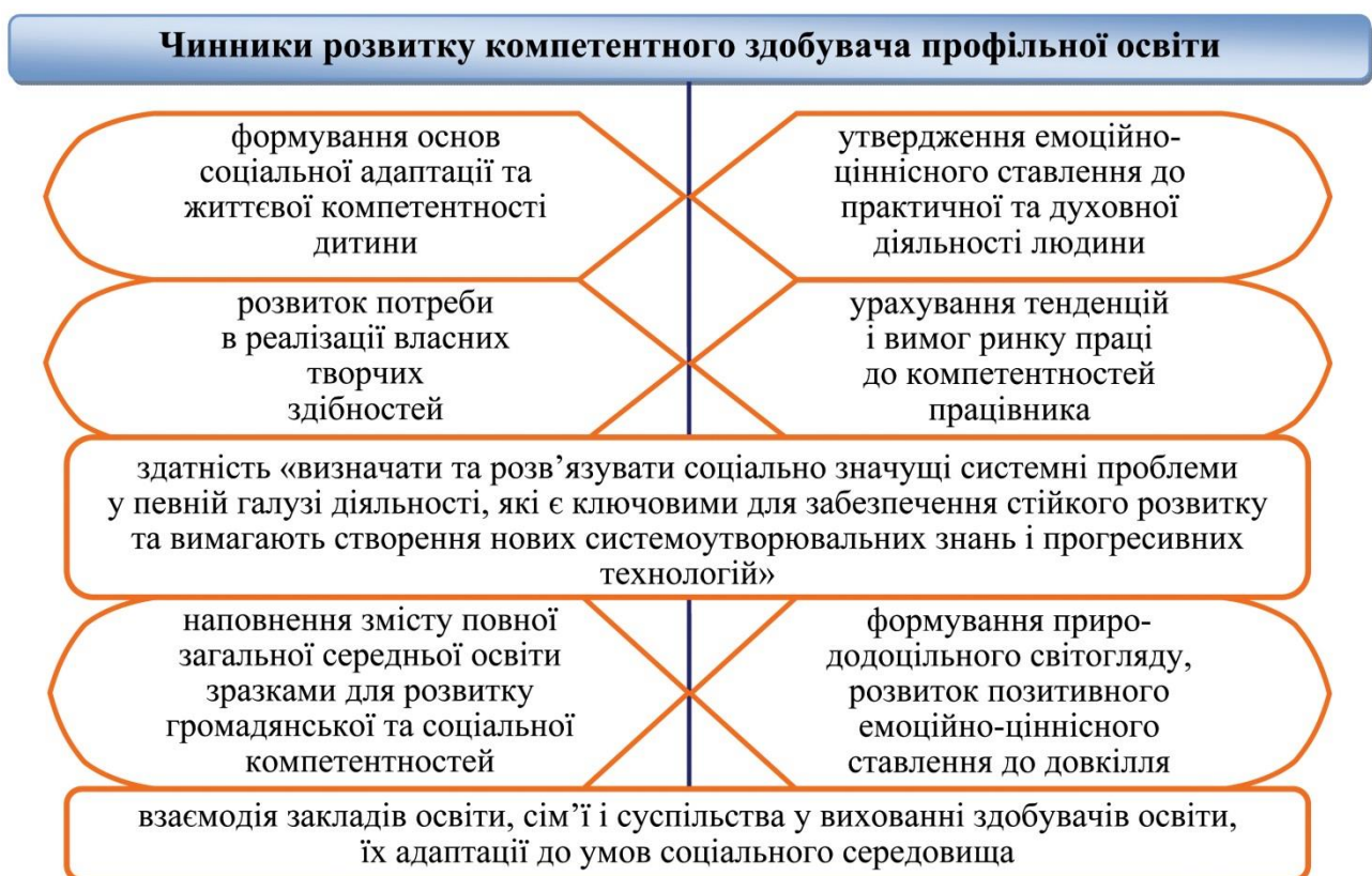
Рис. 3. Чинники розвитку компетентного здобувача профільної освіти

Спираючись на Закон України «Про освіту», акцентуємо на соціально важливих чинниках розвитку ключових компетентностей здобувача профільної освіти 245 (Рис. 3), формування якої узалежнюється від низки окреслених нами чинників, де інтеграція є ключовою.