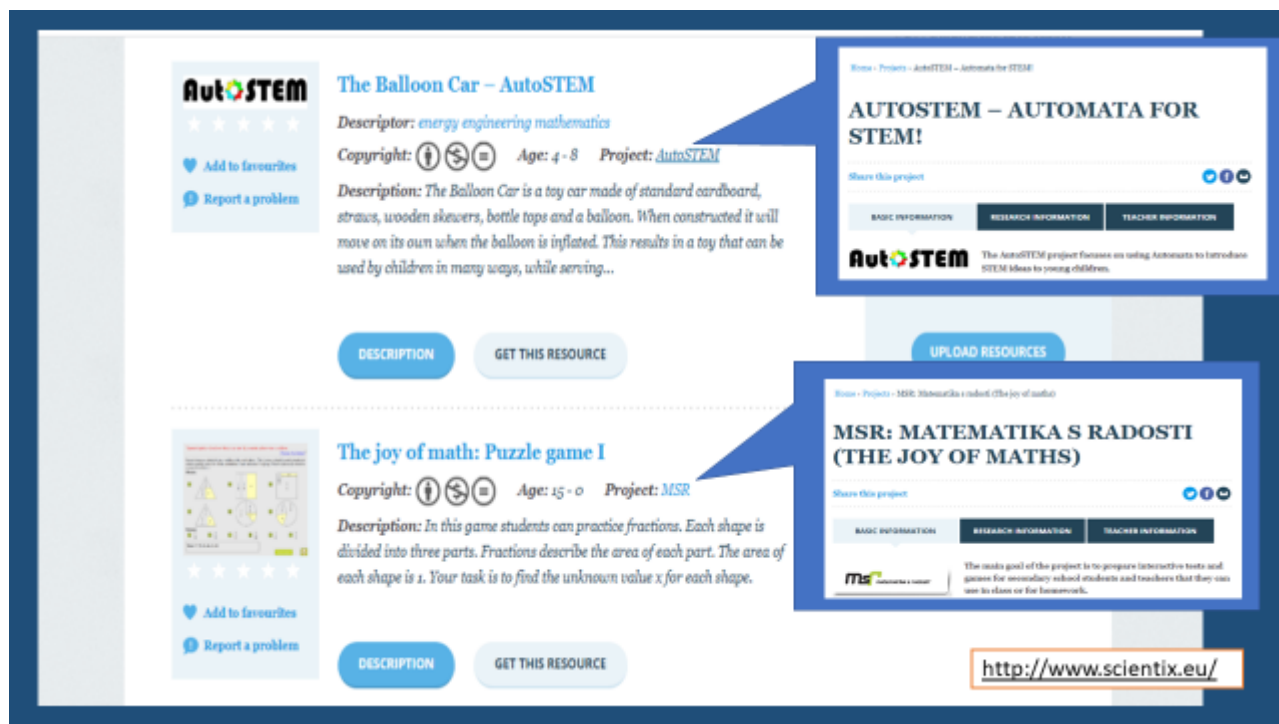
Рис. 4. Виконання запиту за ресурсами сайту Scientix.eu

Так, наприклад (рис. 4), міжнародний проєкт AutoSTEM (Болгарія, Німеччина, Італія, Норвегія, Португалія (координатор), Великобританія) зосереджений на використанні