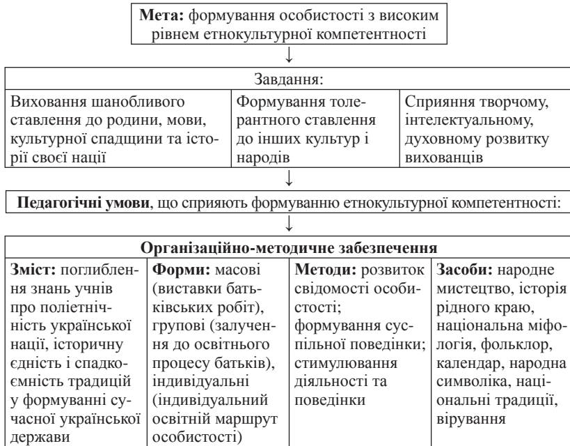
Рис. 1. Структурна модель процесу формування етнокультурної компетентності у вихованців гуртків декоративно-ужиткового мистецтва закладів позашкільної освіти.

Розробляючи методику формування етнокультурної компетентності ми керувалися наступними принципами. Один з принципів, яким ми керувалися при проведенні дослідження був принцип природовідповідності . Цей принцип передбачав урахування педагогом в освітньому процесі не тільки вікових, психологічних, а й етнічних (національних) особливостей дитини.