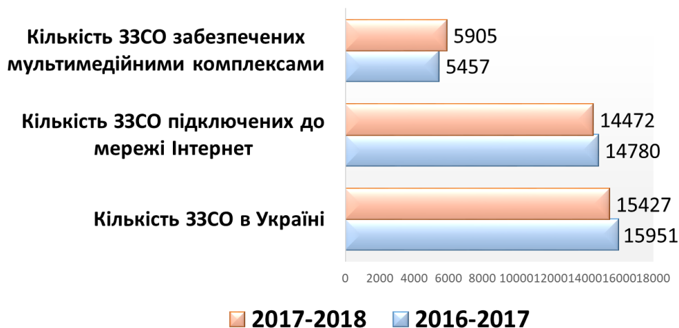
Рис. 1. Стан забезпечення ЗЗСО комп'ютерною технікою

Незважаючи на формальну наявність у школах комп'ютерної техніки їхня кількість (рис. 1) і якість забезпечення (табл. 1) є недостатньою, що підтверджується статистичними даними Державної служби статистики України ( Ukrstat.org, 2018 рік ).