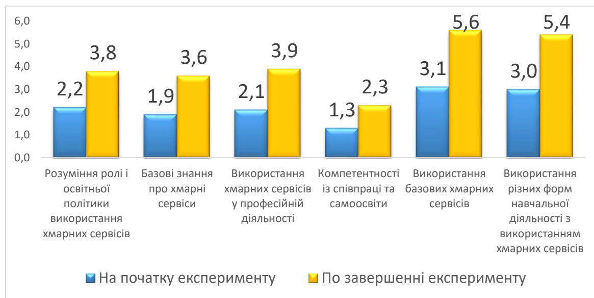
Рис. 3. Динаміка розвитку ІК-компетентності вчителів-предметників

Протягом 2014-2016 рр. у процесі реалізації проекту, відповідно до рекомендації ЮНЕСКО (2011 р., 2013 р.) було проведено навчання і опитування вчителів щодо використання новітніх сервісів в освітньому процесі і встановлено, що динаміка розвитку ІК-компетентності вчителів сягає 35-40% (рис. 3). Зазначимо, що ставлення вчителів та учнів до використання сервісів в освітньому процесі значно покращилося [5].