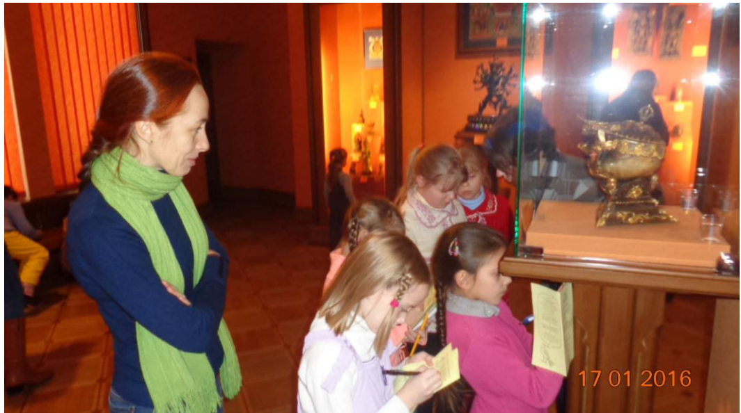
Рис. 2. У залі буддизму, юні пошуковці знайшли серед експонатів чашу для богослужінь, виготовлену зі справжнього черепа людини – канала .

В залі буддизму (помаранчева) є чимало незвичних предметів. Потрібно знайти серед них чашу для богослужінь, виготовлену зі справжнього черепа людини (ще раз рис. 2).