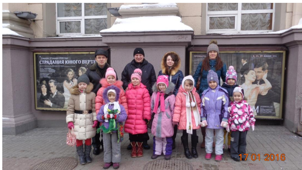
Рис. 1. Зимовим ранком – завзято до мандрівки.

На базі сучасного театру ще в 1891 році створюється театральна трупа російського режисера і актора Миколи Соловцова . А перший театральний сезон Російського державного драматичного театру розпочато 15 жовтня 1926 року. В цьому році театр відзначатиме 90-ліття своєї театральної діяльності. 1941 році театру було присвоєно ім'я Лесі Українки . І знову ювілейна дата – 145 років видання «Лісової пісні» поетеси (2016). Тож ми порадили почитати твір разом з дітьми.