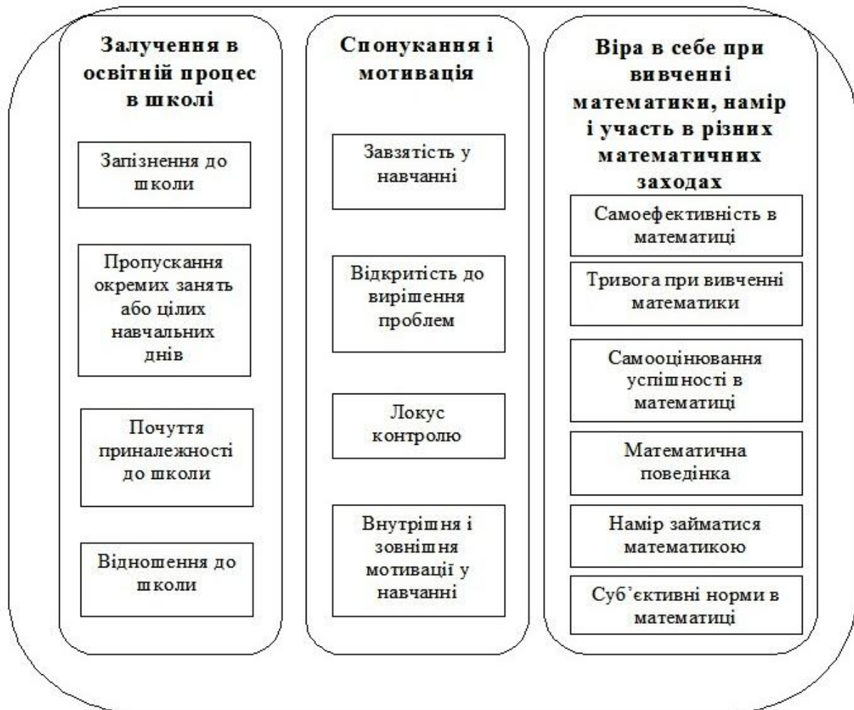
Рис. 2. Фактори ефективного навчання [17, с. 16].

Модель ефективного навчання, яку було розроблено в дослідженні PISA, подано на рис. 2.