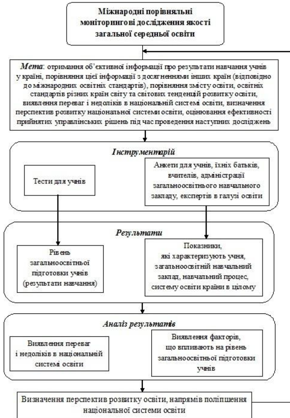
Рис. 3. Авторська модель міжнародних порівняльних моніторингових досліджень якості загальної середньої освіти.

З рис. 3 бачимо, що у міжнародних порівняльних моніторингових дослідженнях якості загальної середньої освіти використовуються тести для